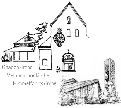
Gnadenskirche Melancthonkirche Himmelfahrtskirche

evangelisch in Buchenbühl und Ziegelstein